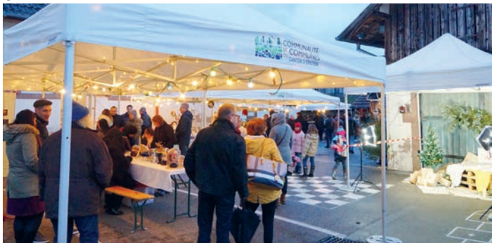
1 ER MARCHÉ DE NOËL : Le 1 er marché de Noël dans la cour de l'école élémentaire organisé par la commune avec la participation des associations locales. (15/12)