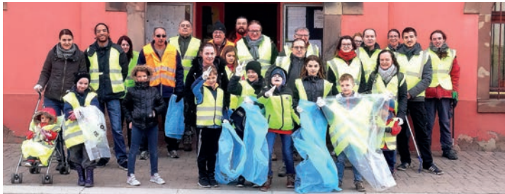
OSCHTERPUTZ : Au départ de la mairie, jeunes et moins jeunes étaient encore une fois mobilisés pour le nettoyage de printemps. (13/04)