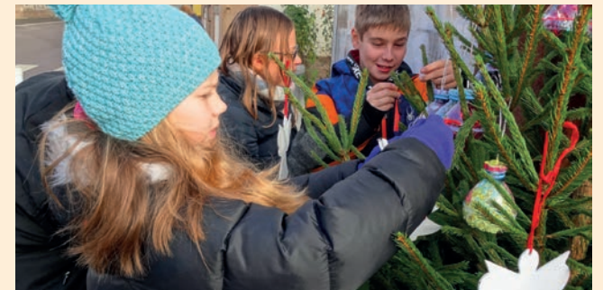
Naïa : nous avons décoré les sapins des écoles.