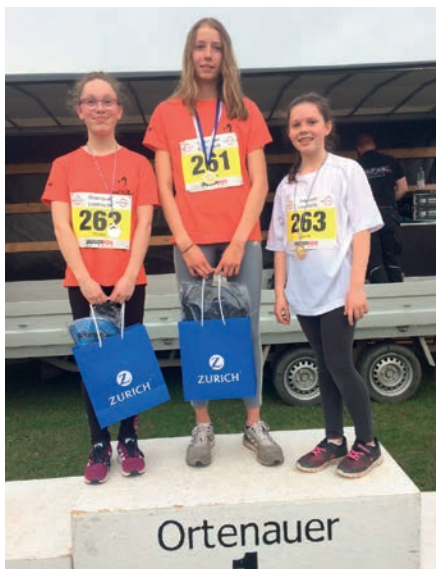
Les plus méritantes ont été récompensées

Nous vous attendons nombreux à cette rencontre franco-allemande en 2020.