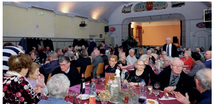
FÊTE DE NOËL DES AÎNÉS : La bonne humeur et la convivialité étaient de mise à la fête de Noël des aînés, avec le soutien du Crédit Mutuel de Benfeld. (08/12)