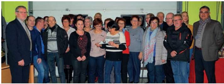
MAISONS FLEURIES : La cérémonie a permis de féliciter et de remercier les lauréats du concours. (10/01)