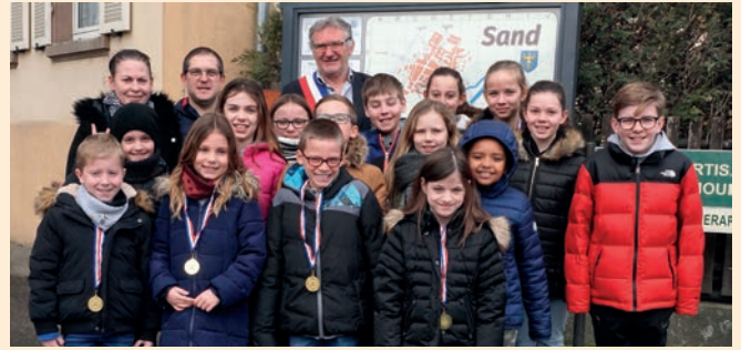
Luna : nous avons accueilli les nouveaux conseillers.