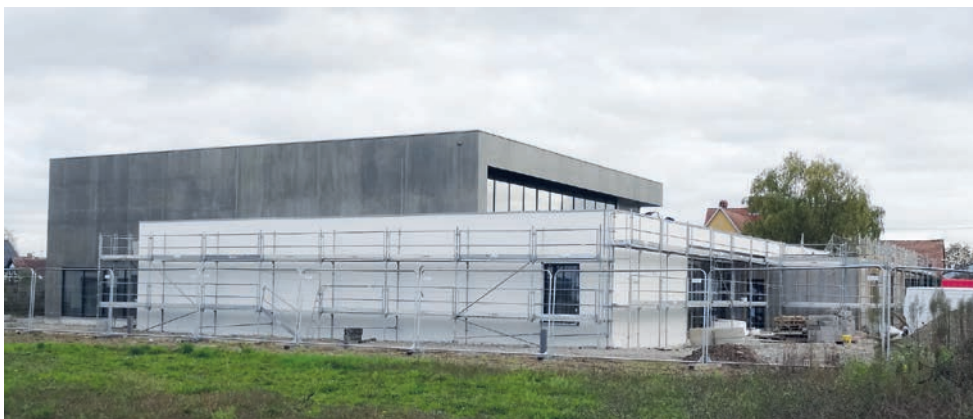
La salle multifonctions

La Région Grand Est a confié le déploiement de la fibre optique à la Société Rosace. Le réseau est en place et la connexion des particuliers a commencé. Seule la rue du Staettacker n'est pas desservie : la liaison aérienne entre la rue de Matzenheim et la rue du Staettacker n'est pas possible parce que le câble passerait au-dessus d'une propriété privée comme c'est déjà le cas pour la ligne téléphonique. Le Maire a pris contact avec Orange pour que le problème soit réglé. Rosace a organisé une réunion d'information à Uttenheim le 13 novembre ; si des questions demeurent les habitants peuvent consulter le site internet de la société au : www.rosace-fibre.fr