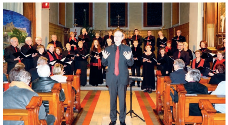
CONCERT DE NOËL : Concert par l'Ensemble Vocal Variations intitulé « Peace on Earth » composé d'oeuvres sacrées anglaises du temps de Noël. (15/12)