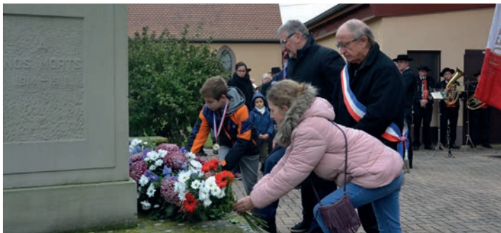
CÉRÉMONIE DE L'ARMISTICE : Des enfants ont participé à la cérémonie commémorative en déposant une gerbe au monument aux morts. (11/11)