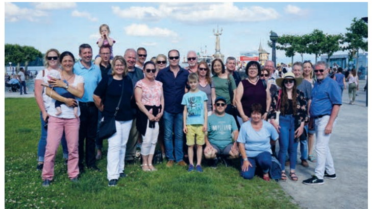
JUMELAGE : Visite de Constance et de l'île de Mainau avec les conseils transfrontalier des communes de Sand, des deux côtés du Rhin. (23/06)