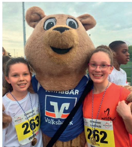
Une soirée conviviale