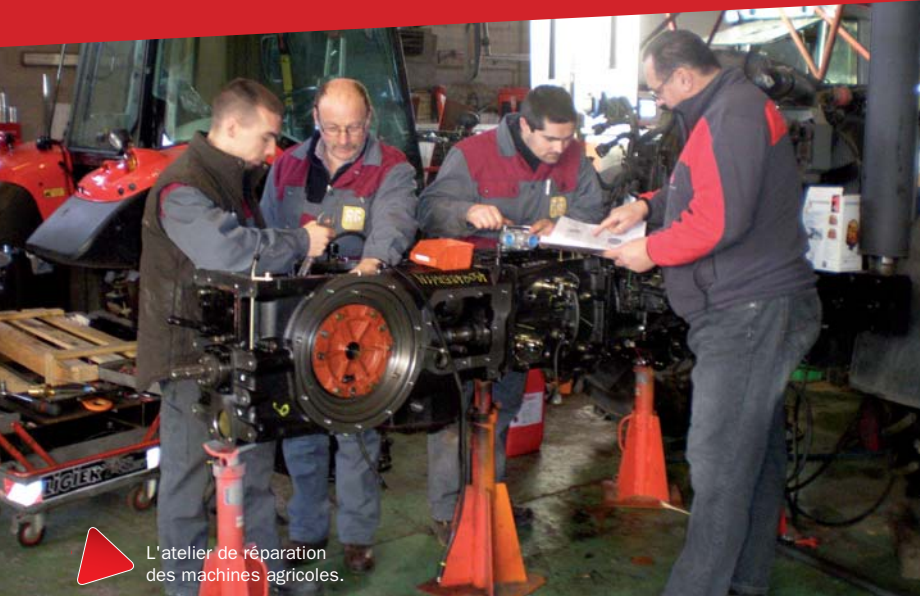
L'atelier de réparation des machines agricoles.