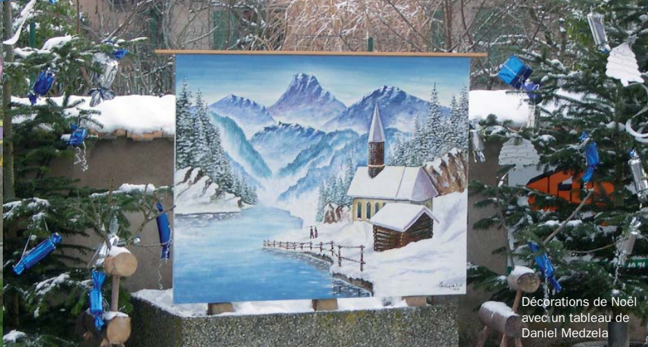
Décorations de Noël avec un tableau de Daniel Medzela