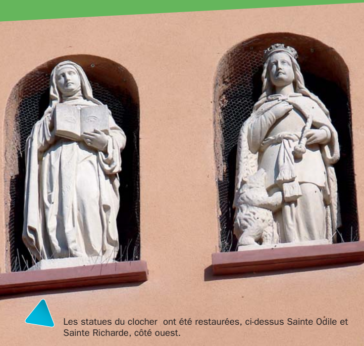
Les statues du clocher ont été restaurées, ci-dessus Sainte Odile et Sainte Richarde, côté ouest.