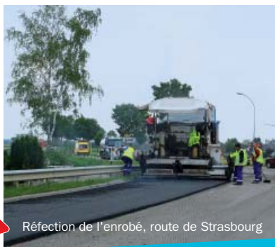
Réfection de l'enrobé, route de Strasbourg

En mai, le Conseil Général a renouvelé le tapis de la D 829, route de