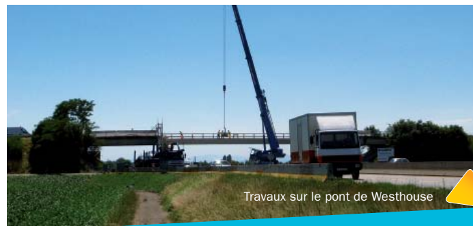
Travaux sur le pont de Westhouse

Les travaux de réparation du pont de Westhouse ont démarré le premier juin et ont été réalisés en trois mois comme prévu