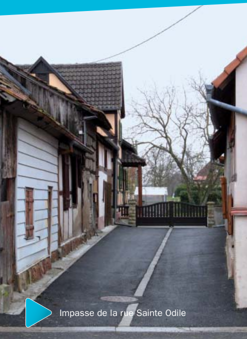
Impasse de la rue Sainte Odile