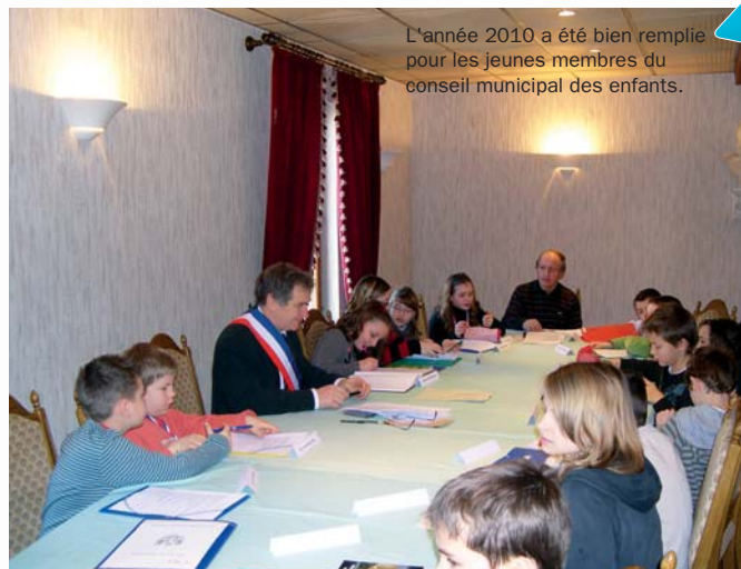
L'année 2010 a été bien remplie pour les jeunes membres du conseil municipal des enfants.