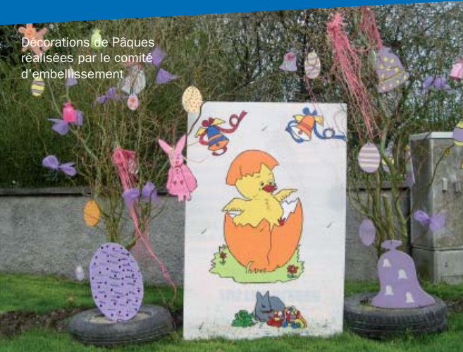
Décorations de Pâques réalisées par le comité d'embellissement