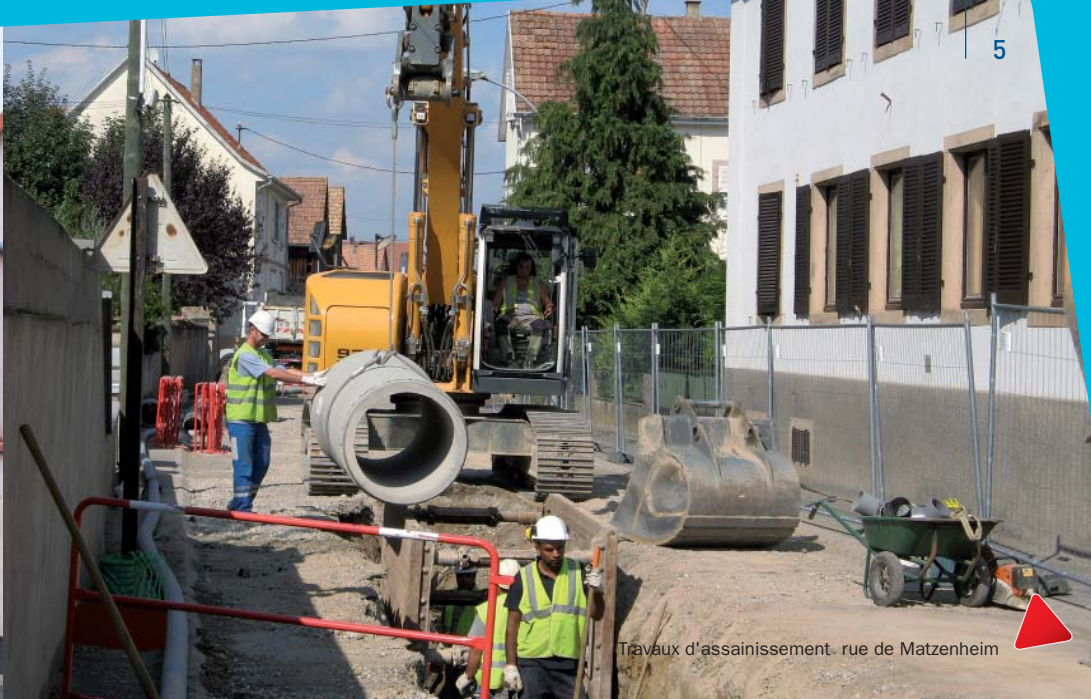
Travaux d'assainissement - rue de Matzenheim

par le Conseil Général. Pendant le chantier, la circulation était coupée sur cet axe. Les agriculteurs qui exploitent des parcelles à l'ouest du village ont dû faire de fréquents détours. Suite à deux rencontres avec les responsables du Conseil Général en mairie de Sand, un régime d'indemnités a été mis en place.