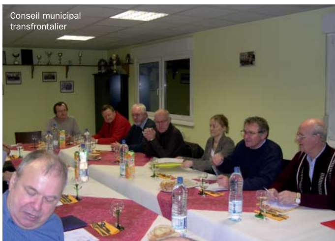
Conseil municipal transfrontalier